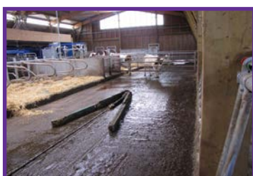
Racleur en V