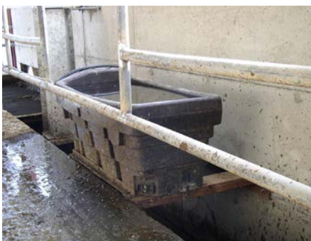
Abreuvoir au dessus du canal à lisier

Il existe un raclage par hydrocurage (nettoyage des couloirs par vagues d'eau). Une étude technique préalable est nécessaire à la réalisation.