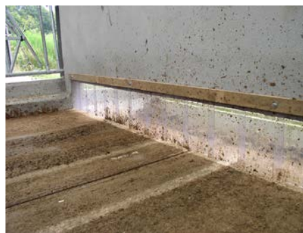
Jupe de protection passage tracteur