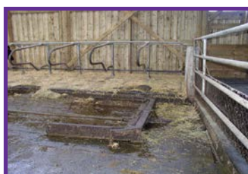
Racleur à câble