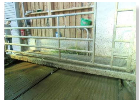
Passage sec sur aire raclée