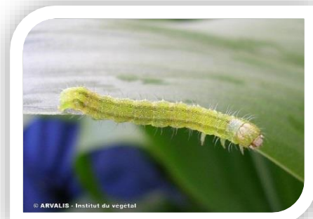
Photo 3 Chenille d'héliothis

1 seul papillon a été recensé cette semaine. (voir tableau ci-dessous)